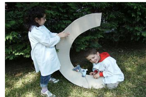
scuola dell'infanzia I.C. di Botrugno (Lecce)

Su iniziativa della Direzione Generale dell' Ufficio Scolastico Regionale per la Puglia e grazie ad una scuola pugliese "viva", capace di cogliere le innovazioni e mettersi in gioco, il Globalismo Affettivo si diffonde con grande successo nella regione, divenendo ormai "buona pratica" istituzionalizzata.