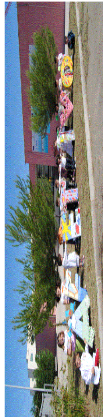
Realizzazione dei bambini della scuola 3° Circolo Didattico "S.G.. Bosco" Massafra ( TA )